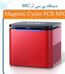
Magnetic Cycler PCR MIC