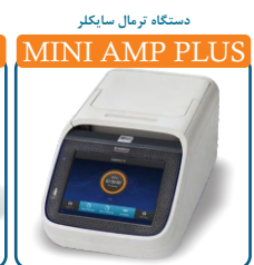
MINI AMP PLUS