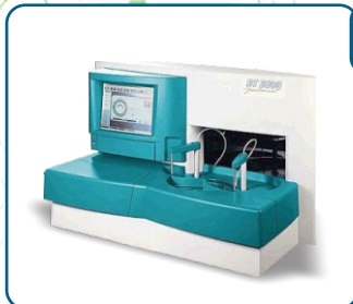
Chemistry Analyzer BS -480 , Analyzer BT -3000

آزمایشگاه نانو در بخش بیوشیمی با بهره گیری از تجهیزات مدرن از جمله دستگاه میندری BS480 و BT3000 و دستگاه یونوگرام و فوتومتر Stat Fax محصول اورنس آمریکا تست های کمیاب از جمله فلزات آهن، روی، مس، منیزیم و ترکیبات آمونیاک، لاکتات و انواع ایمونوگلوبین ها و اجزای کمپلمان و غیره را روزانه پاسخ دهی میکند.