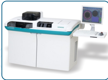
IMMULITE 2000 XPI

۵- بهره مندی مراجعین از امکانات کافی شاپ در طبقه هفتم مجتمع