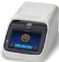
دستگاه ترمال سایکلر MINI AMP PLUS