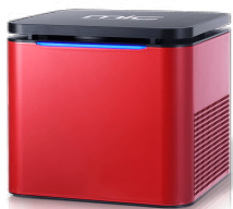
دستگاه پی سی آر MIC Magnetic Cycler PCR MIC