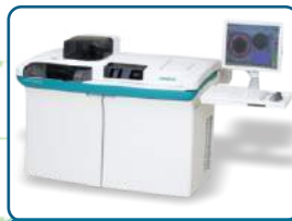
IMMULITE 2000 XPI