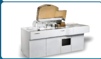
MINDRAY CL 2000i

شماره موبایل مستقر در پذیرش نانو ۰۹۱۴ ۸۰۵ ۲۷۲۴