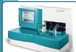
ANALYZER BT - 3000