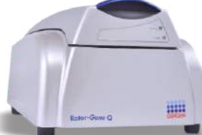
دستگاه ریل تایم پی سی آر QIGEN