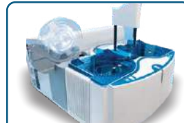
Coagulation Analyzers STAGO