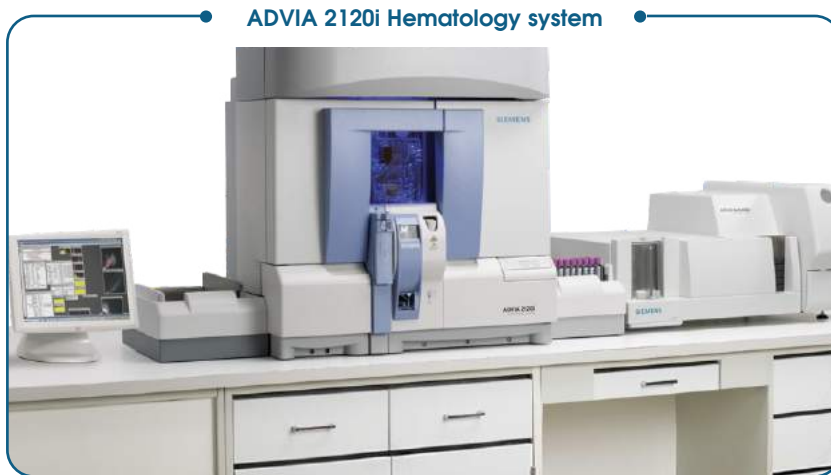
ADVIA 2120i Hematology system

WBC : Atypical LYMPH , Blasts , Immature Granulocytes , Left Shift , Myeloperoxidase Deficiency RBC : ANISO , HC VAR , HYPER , HYPO , Large Platelets , MACRO , MICRO , NRBC , PLATELET CLUMPS , RBC Fragments , RBC Ghosts